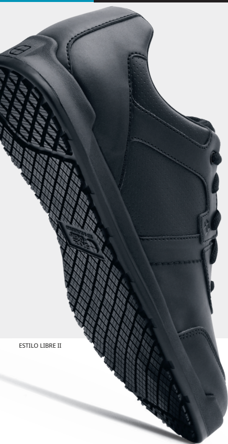
ESTILO LIBRE II